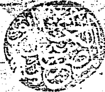
صورة صفحة عنوان الكتاب